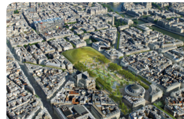
Projet : La Canopée - Patrick BERGER et Jacques ANZUETH architectes Le jardin : SEURA et Philippe RAGUEN Les aires de jeux : Henri MARQUET architecte - IMAGINAL Ingénierie - AEP architectes paysagistes Perspective : STUDIOREZZ.COM

Les élus socialistes du 2 ème arrondissement se félicitent du démarrage du projet d'ensemble de rénovation du jardin et du forum des Halles, qui fait suite à une période d'élaboration du projet menée dans la concertation depuis plusieurs années.