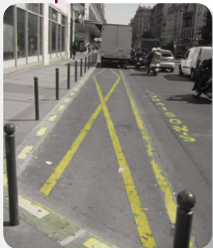
MARQUAGE DES EMPLACEMENTS EN ZONE « LIVRAISON »

Cette disposition sera effective d'ici la fin de l'année 2010 dans tout Paris après une période de travaux de matérialisation du marquage.